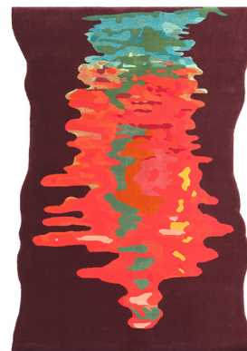
TP 03 Sunset