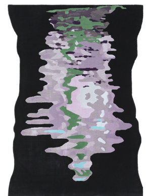
TP 04 Dusk

I dati forniti in questa scheda tecnica sono aggiornati al momento della pubblicazione. Carpet Edition si riserva il diritto di modificare materiali, dimensioni e caratteristiche senza preavviso. The data provided in these technical specifications are up to date at the time of publication. Carpet Edition reserves the right to modify materials, sizes and characteristics without notice.