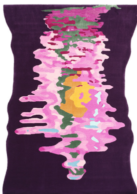
TP 01 Down